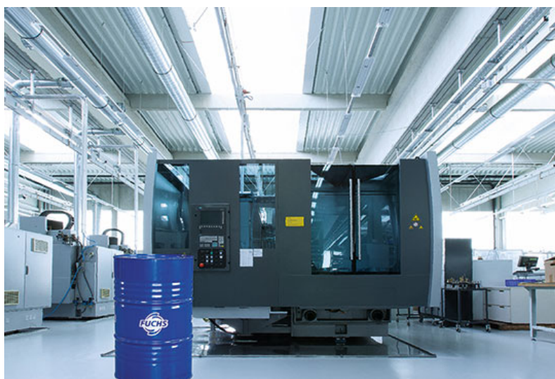
Avec 415 ingénieurs et scientifiques dans le monde, et plus de 600 projets, la R&D FUCHS garantit à ses clients performance et durabilité, fiabilité et sécurité, efficacité et réduction des coûts

Cela passe, bien entendu, par les services d'accompagnement proposés aux clients, parmi lesquels les services analytiques, de gestion des fluides, de Suivi des Produits en Service, d'audit et d'usinage des engrenages ouverts.