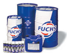
Lubrifiants et spécialités chimiques pour l'usinage