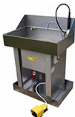
Fontaines de nettoyage et machines à laver