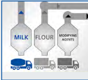
1. Entrega, recepción, almacenamiento