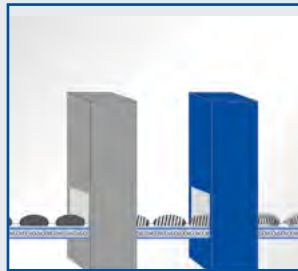
5. Rebanado, envoltura